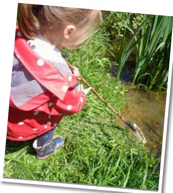
Journée à la mare pour les élèves de l'École Maternelle avec un animateur de la Maison de la Rance