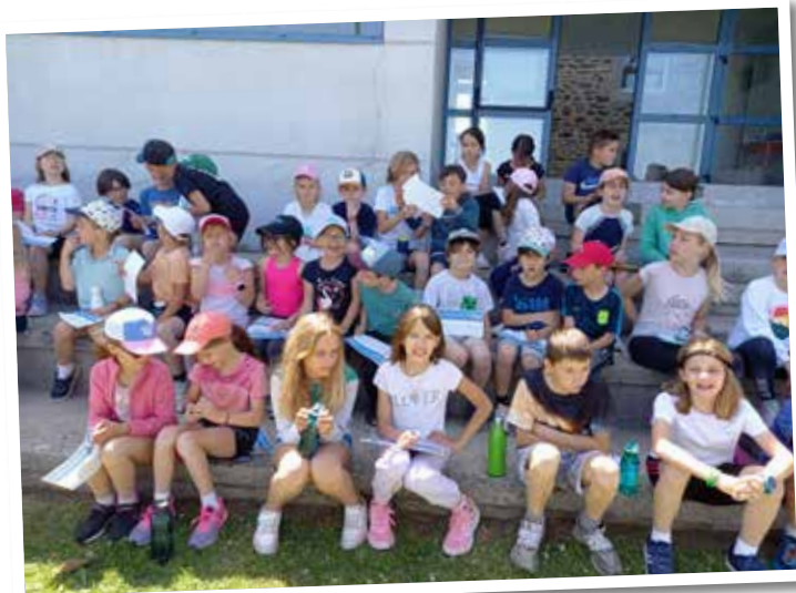
Participation des élèves de l'Ecole Élémentaire à la Course contre la faim