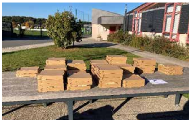
Distribution pizzas du 17 octobre 2025.