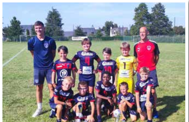
vainqueurs du tournoi

Le premier week-end de septembre, le Club était heureux de relancer le tournoi U10/U11 sur le terrain de Taden bourg. Ce fut l'occasion d'accueillir 9 équipes qui se sont rencontrées sous forme d'un championnat, remporté cette année par le Stade Paimpolais. Toutes les équipes ont pu être récompensées grâce au soutien de la municipalité qui a pris en charge les lots. Merci à eux ! Bien entendu la date est déjà réservée pour la saison prochaine.