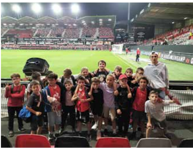
U11 invités pour un match à Guingamp